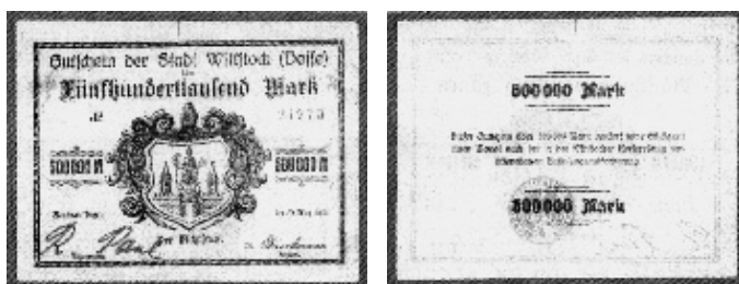
Abb. 5: Wittstock, 500 000 M (G23) VS/RS