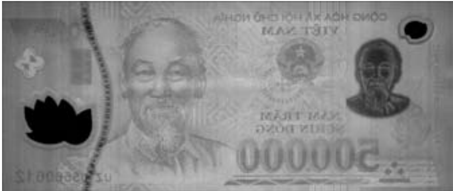
Abb. 1: Manipulierte Rückseite eines 500.000-Dong-Scheines

Mir liegen einige dieser ominösen Banknoten vor, um diese genauer betrachten zu können. Hält man solche manipulierten Banknoten schräg gegen das Licht, sieht man deutlich ein Relief des ehemaligen Druckes. Das be-