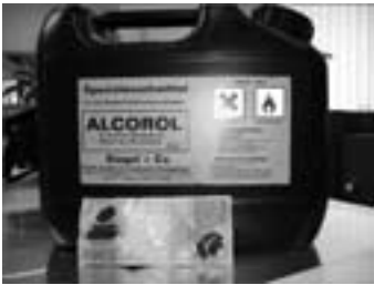
Abb. 4: Druckerei / Walzenreinigungsmittel

Singapur, denn diese Banknote stammt von der Orell Füssli in der Schweiz. Somit sind mehrere Aspekte vorhanden, dass es sich hier um echtes Machwerk handelt. Bleibt noch die Frage, wie man die Farbe vom Träger, also der Banknote, abwaschen kann. Eines ist klar, Druckfarbe besteht aus Chemie. Für fast jede chemische Verbindung gibt es eine andere chemische Verbindung, die diese auflösen kann. Durch Kontakte zu Druckereien und Folienherstellern bin ich auf eine Chemikalie gestoßen. ALCOROL, ein Reinigungsmittel für Druckwalzen, also ein technischer Alkohol.