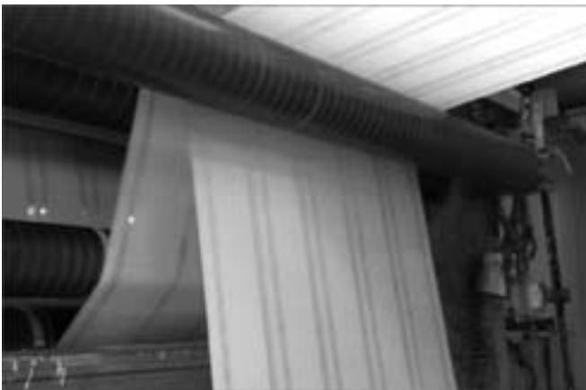
Abb. 3: Blick in die Produktion, bedrucken des Untergrundes

Kleine Stellen, die frei bleiben, sind das OVD, also das durchsichtige Fenster. Viele kleine Düsen werden computergesteuert genauestens ausgerichtet und spritzen die